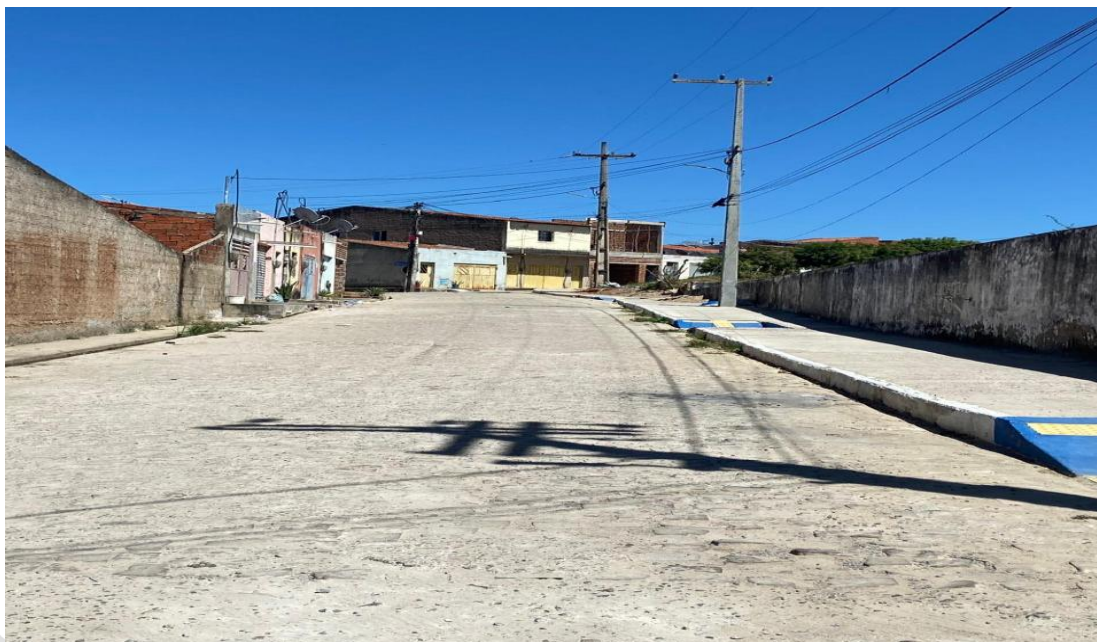
Imagem da Rua